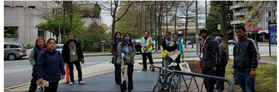
Abril 2020- Mga manggagawa ng GDI sa Gordon and Leslie Diamond Health Care Centre

Ang mga janitor ng GDI ay kabilang sa frontline workers na pinapanatiling ligtas at malusog ang publiko sa panahon ng pandemyang ito.