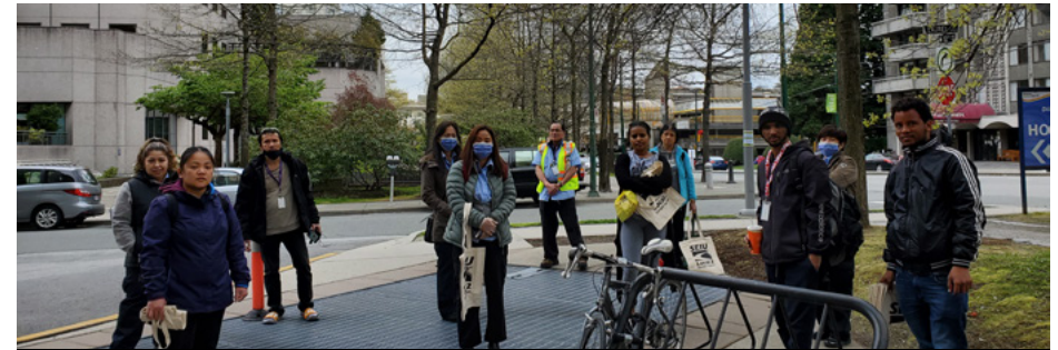
Abril 2020- Trabajadores de GDI en el Gordon and Leslie Diamond Health Care Centre

Actualización Importante sobre Negociaciones 2020: Instalaciones Integradas GDI